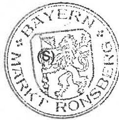
Michael Sturm Erster Bürgermeister

Angeschlagen am: 22.05.2023 Abgenommen am: 30.06.2023