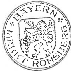
Michael Sturm Erster Bürgermeister

Angeschlagen am: 22.05.2023 Abgenommen am: 30.06.2023