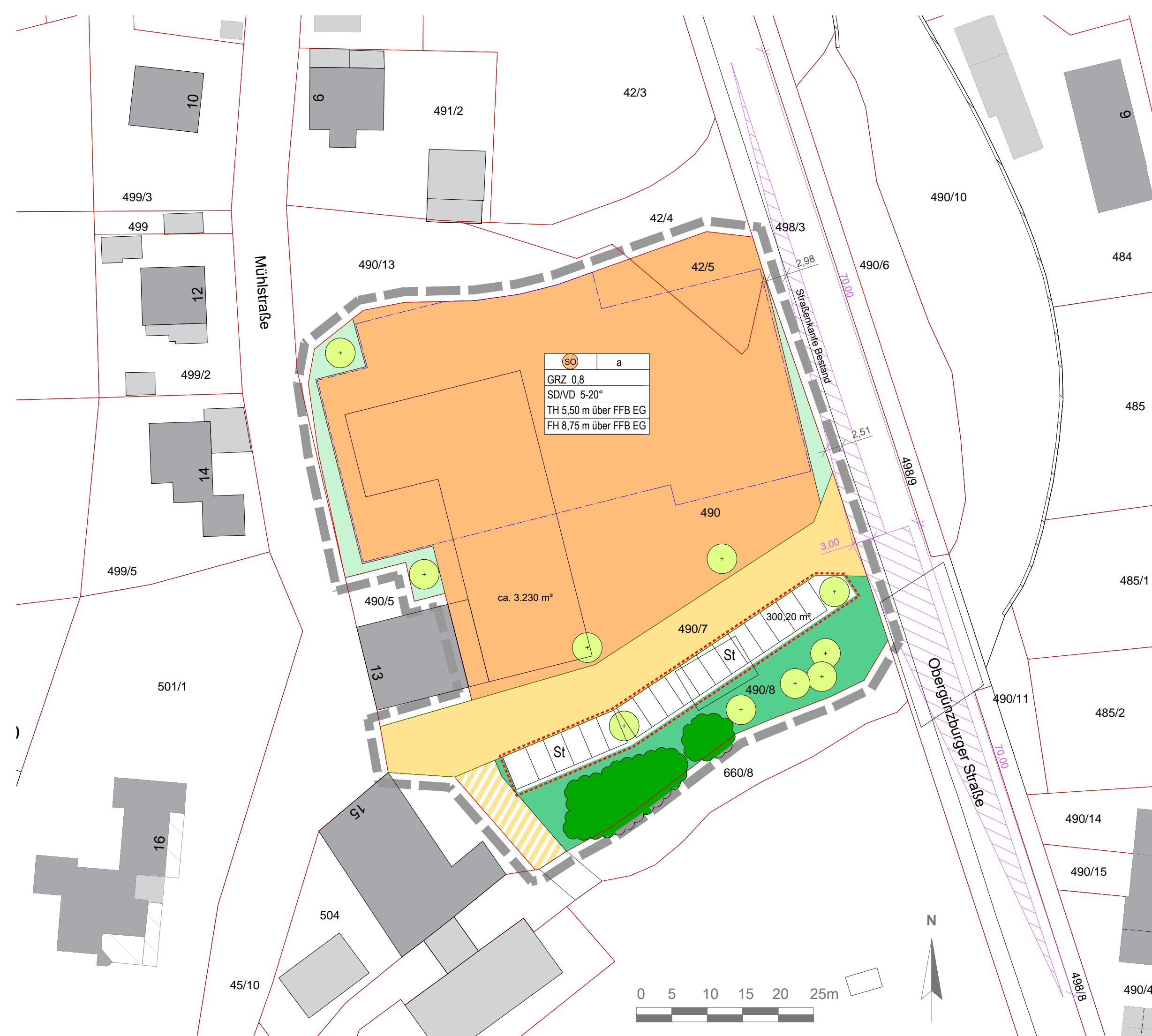
1. Planzeichnung M 1:500